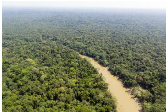
Imagem aérea da Floresta Amazônica

Já nas áreas tropicais, encontram-se algumas florestas típicas, das quais merece destaque o cerrado brasileiro — uma formação vegetal em forma de savanas com áreas bastante degradadas pela atuação agrícola. Mas é na área equatorial que se encontra a principal floresta, a Amazônica, que é responsável pela maior biodiversidade do continente. Existem ainda outros tipos de formações vegetais ao longo das Américas, como a Caatinga, no Brasil, e alguns tipos de vegetação de altitude nas áreas mais elevadas, tanto ao norte quanto ao sul.