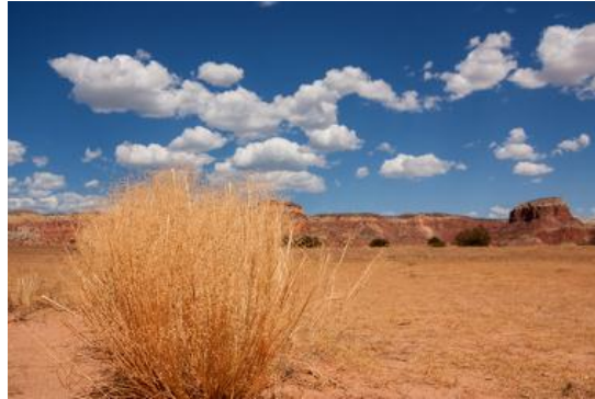
Paisagem desértica no Novo México

Em várias áreas na América do Norte e na América do Sul, os climas temperado e continental predominam, com a existência também de áreas desérticas e semiáridas graças ao bloqueio das massas de ar pelas formas de relevo, como ocorre no Nordeste brasileiro, no Chile e nos desertos dos Estados Unidos e México.